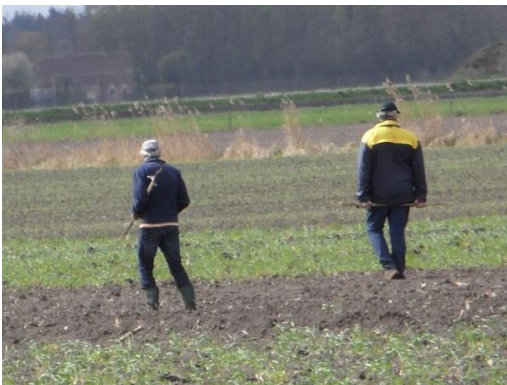
nesten zoeken op het land